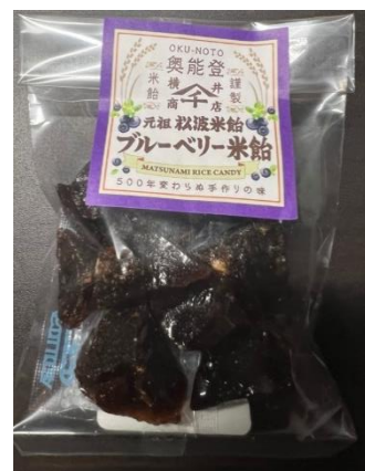
ブルーベリー米飴