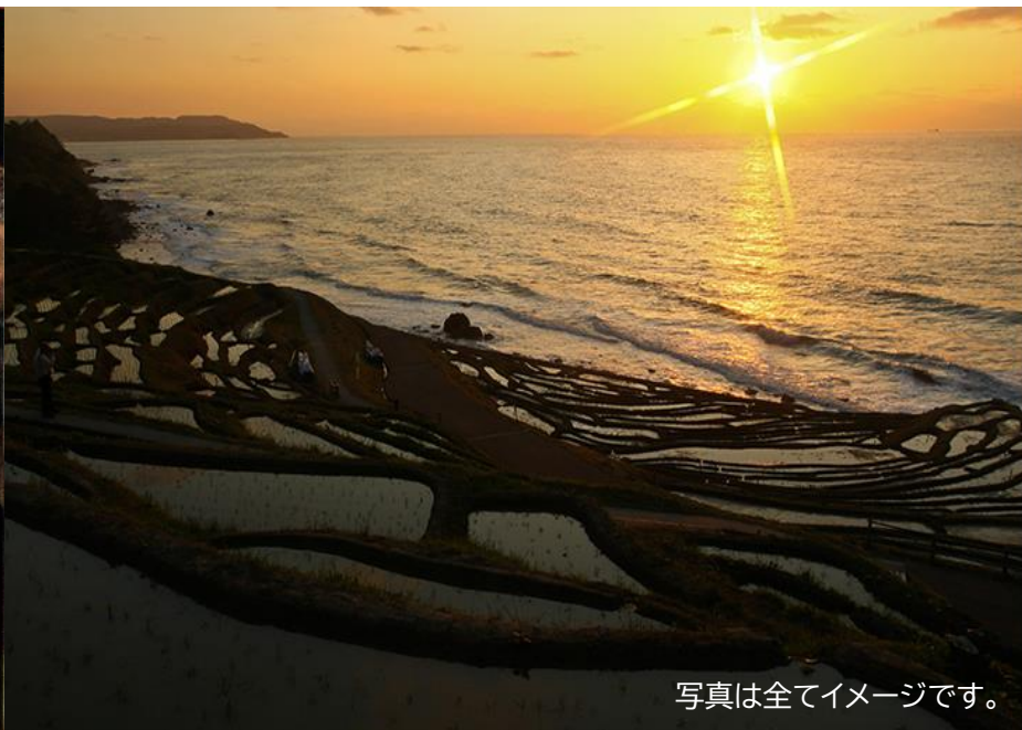
写真は全てイメージです。